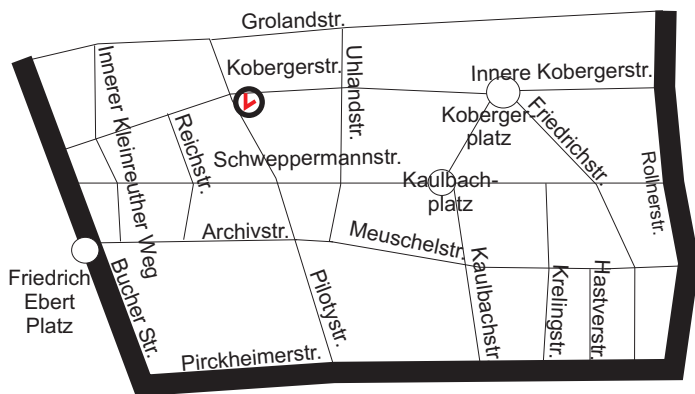
Grafik: Pia Rubner